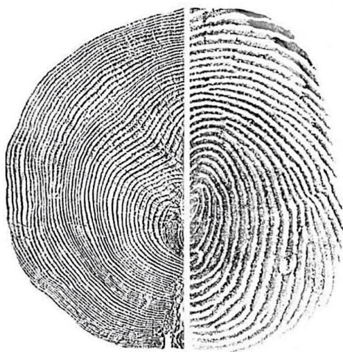
Aldersringe på et træ og et menneskes finger-aftryk.

son, 1994/2006). Forfatterne tilføjer palæontologiens formelle vanskeligheder: fossilers stratigrafiske position i jordlaget, for når fossilet er blevet taget op har vi kun finderens udsagn for hvor det var, fundstedet bliver med tiden ødelagt af erosion, minedrift, byggeri med videre eller umuligt at genfinde. Hertil kommer geologiske og landskabsmæssige forskydninger: jordskred, genopfyldte regnkløfter med videre. Desuden kan dyr forskubbe jordlagene. Og ligger fossiler for dybt, sedimenterer de. Data som ikke bekræfter forskerens tese, forties måske, offentliggjorte kranier forsvinder på mystisk vis efter indvendte kritikpunkter, eksempelvis Foxhall-kæben, 'maureren' og Beijingmennesket. Andre fund indrapporteres ikke, idet forskerne måske ikke antager det for muligt at artefakten lå i korrekt jordlag. Desuden anses ofte fejlagtigt, at nutidigt udseende knogler ikke kan være af ældre dato.