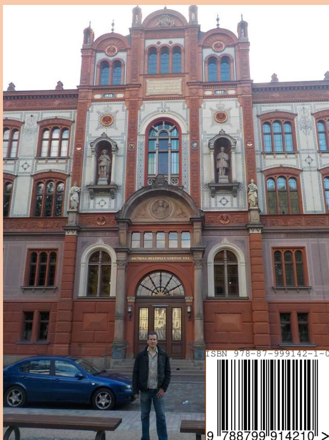
universitetet i Rostock, grundlagt 1419